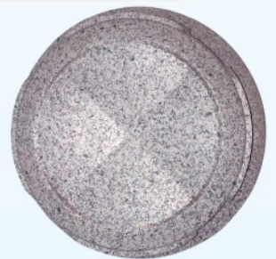
仿大理石烤漆範例